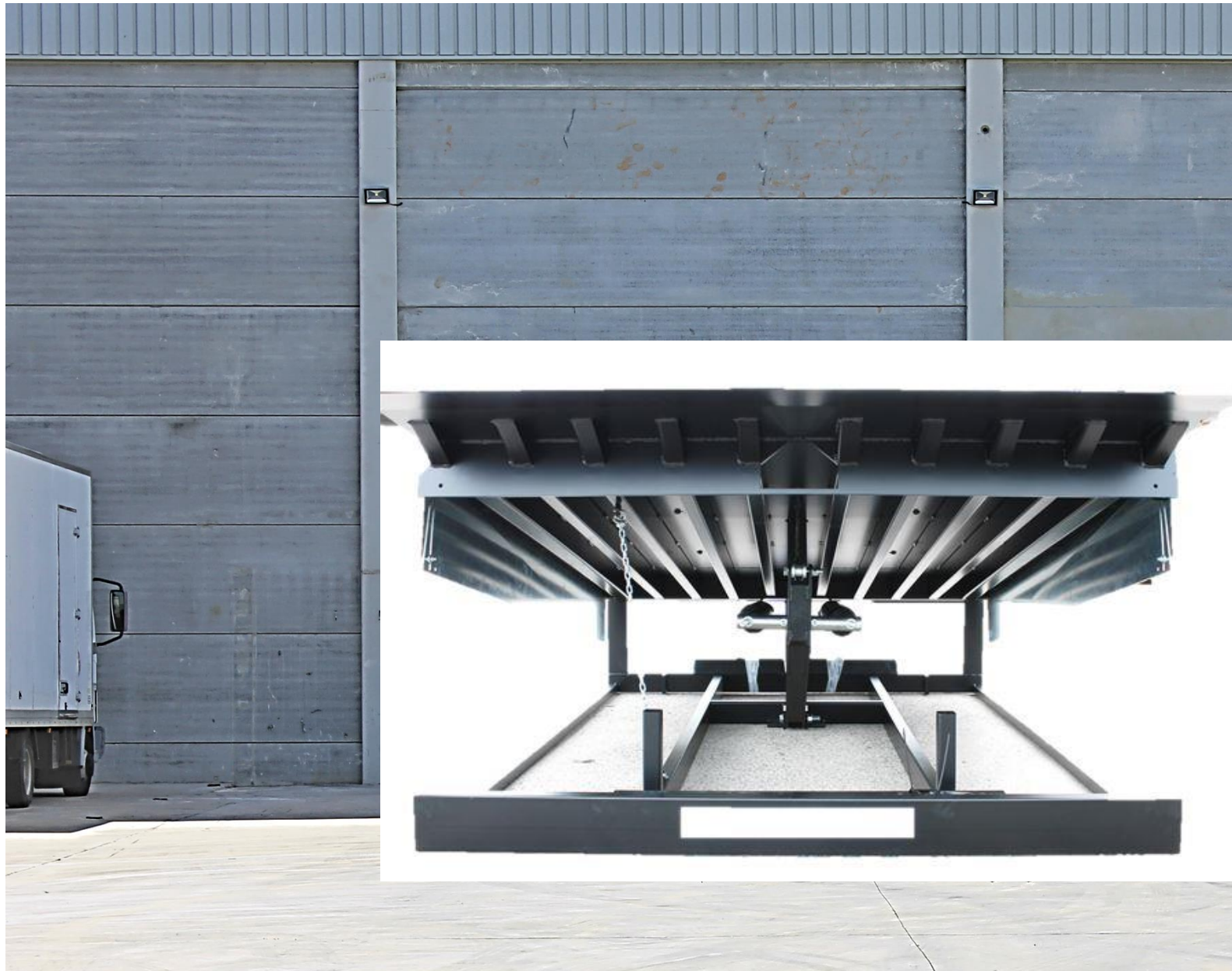
MUELLE MECANICO de accionamiento por resortes